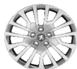
Колпаки штампованных стальных дисков 17" MIAMI