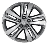
Литые алюминиевые диски 17" BLACK PHOENIX