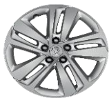
Литые алюминиевые диски 17" PHOENIX